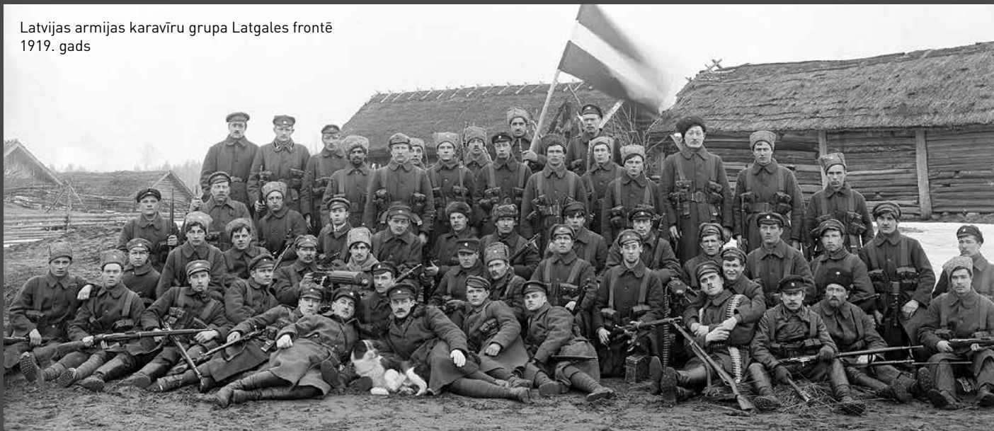
Latvijas armijas karavīru grupa Latgales frontē 1919. gads

202 bijušie latviešu strēlnieki saņēma Latvijas militāro apbalvojumu – Lāčplēša Kara ordeni.